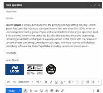
Potpis u e-pošti