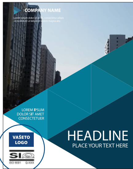
Katalog na proizvodi