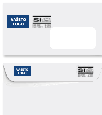
Pliko za pisma