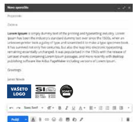
Potpis vo e-mail