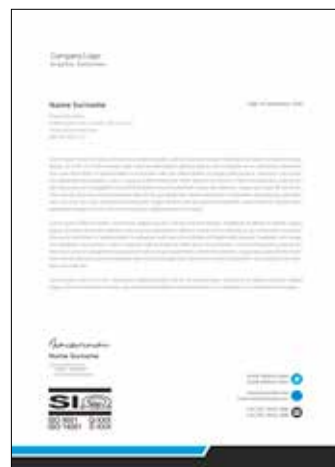
Dopisi in drugi dokumenti