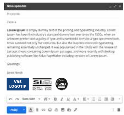
Podpis v e-pošti