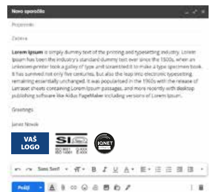
Potpis u e-pošti