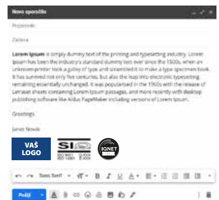
Potpis u e-pošti