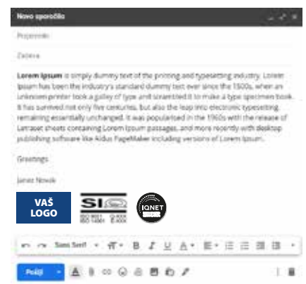
Potpis u e-pošti