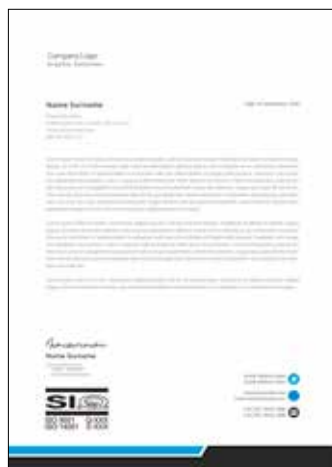
Dopisi in drugi dokumenti