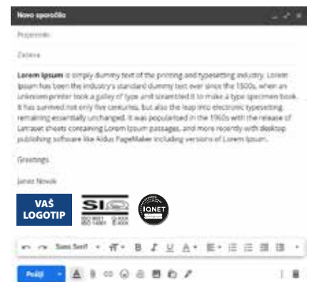
Podpis v e-pošti