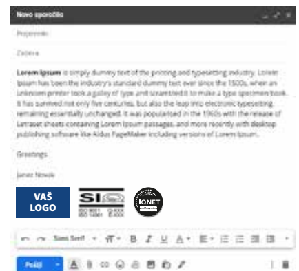
Potpis u e-pošti