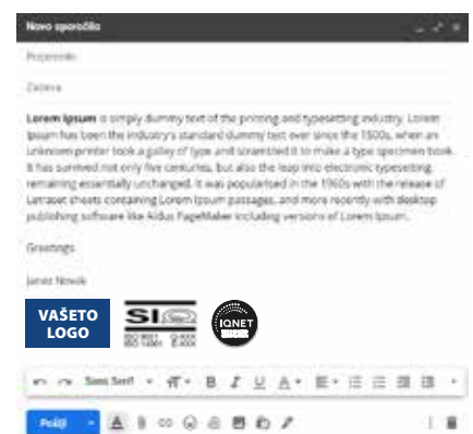
Potpis vo e-mail