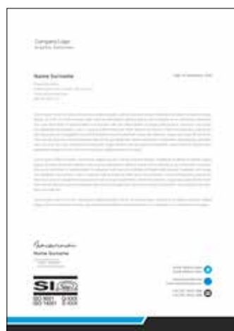
Dopisi i drugi dokumenti